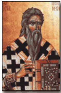
St. Petar I

Владика Данило , 1670-1735. Рукоположио га патријарх Арсеније III Чарнојевић. Врши истрагу потурчењака у Црној Гори. Први успоставља везе са Русијом. Владичанство у породици Петровића лостаје наследно.