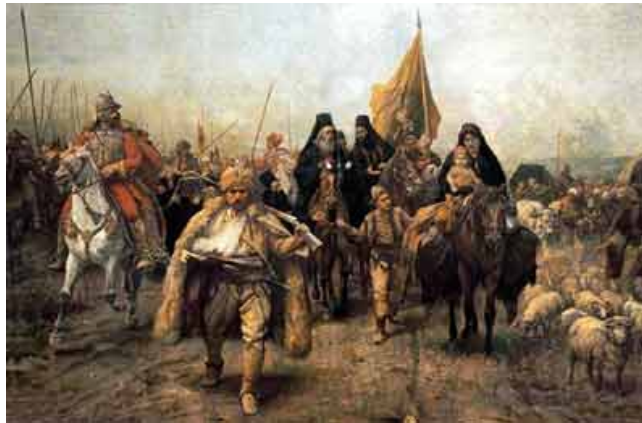
Velika Migracija Srba 1690

Веома тешке последице по наш народ и Цркву имао је аустријско-турски рат, који се водио у време пећког патријарха Арсенија III Чарнојевића (1674-1690;+1706). Турци су 1683. год. угрозили и сам Беч, и били су на прагу Средње Европе. Захваљујући помоћи Пољака, Турци су одбијени. Генерал Пиколомини је 1689. потиснуо Турке до Скопља. То је охрабрило Србе и самог патријарха да се придруже Аустријанцима. Међутим, убрзо је уследила турска контраофанзива, пред којом Срби узмичу у Великој сеоби 1690. год., када је Саву и Дунав са патријархом Арсенијем на челу прешло око 40.000 људи. Аустријски цар Леополд I примио их је на своју територију, гарантујући им верске и националне слободе у специјално издатим привилегијама. У потоњој својој историји, на територији Аустрије и Угарске Срби ће морати више пута да се боре за остварење верских и националних слобода, јер је Аустрија као римокатоличка земља имала увек јасне планове да Србе однороди и покатоличи, што се може видети на многим конкретним примерима.