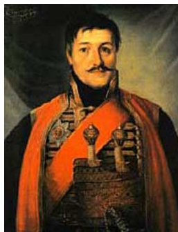
Djordje Petrovic, Karadjordje